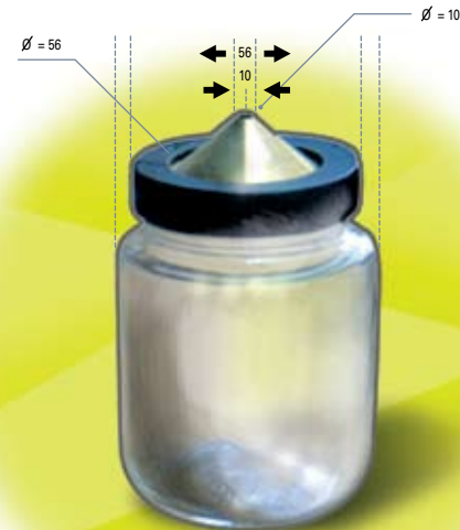
Figura 1: Picnómetro.

Pisón: Debe ser metálico, cilíndrico con una masa de 340\text{ g} \pm 15\text{ g} y con una superficie de apisonamiento plana y normal al eje longitudinal, con un diámetro de 25\text{ mm} \pm 3\text{ mm} .