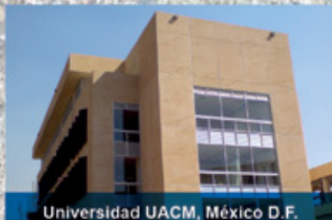
Universidad UACM, México D.F.