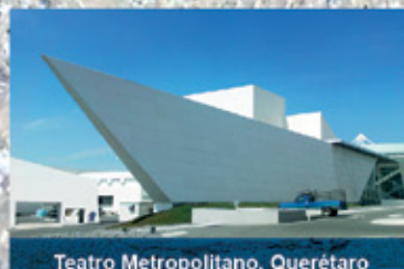
Teatro Metropolitano, Querétaro