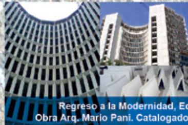
Regreso a la Modernidad, Edificio Hotel Plaza, México D.F., 1943 Obra Arq. Mario Pani. Catalogado por el Instituto Nacional de Bellas Artes