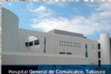
Hospital General de Comalcalco, Tabasco