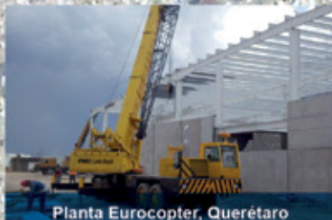
Planta Eurocopter, Querétaro