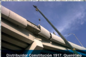
Distribuidor Constitución 1917, Querétaro