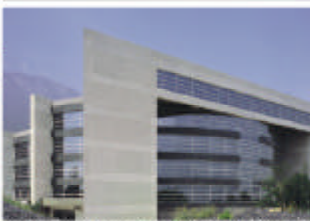
Rectoría UDEM, San Pedro Garza Garcia, Nuevo León