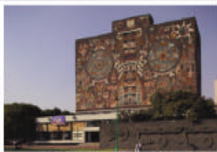
Rectoría UNAM, México, D.F.