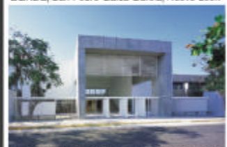
Centro Universitario Montejo, Mérida, Yucatán