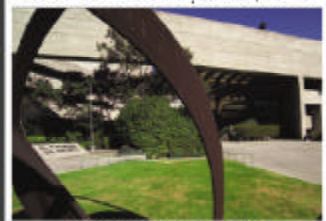
Colegio de México, México, D.F.