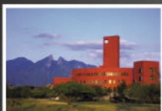
EGADE, San Pedro Garza Garcia, Nuevo León

El inicio del nuevo siglo ha traído una transformación en las necesidades educativas de México: han llegado nuevas generaciones ávidas de la educación superior que les permita competir en la cultura global. Hoy día nuestro país construye —con gran participación de las instituciones privadas— universidades, tecnológicos e institutos de postgrado de calidad internacional. Aprovechando las texturas cálidas y los acabados vistosos que el concreto otorga a estos nuevos centros educativos, sus diseñadores han creado los ambientes más armoniosos, conducentes al aprendizaje de primer nivel.