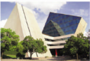
CETEC, ITESM, Monterrey, Nuevo León